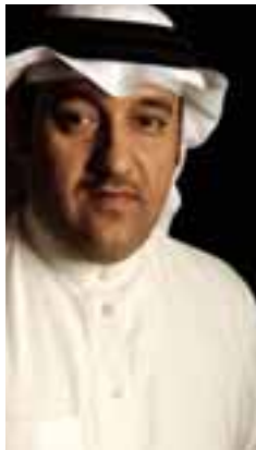
...OÉ a G a Sfj