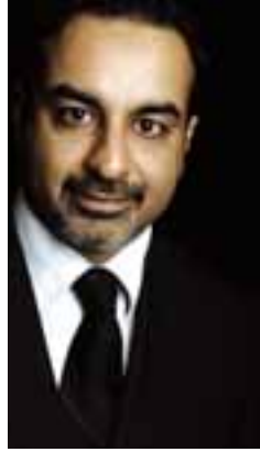
Q a fi óLÉe