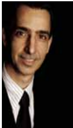
...ó a Mó a h