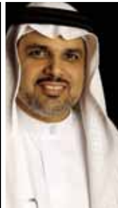
Ühó e GAÓ u