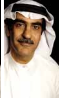
áLÉyG a L