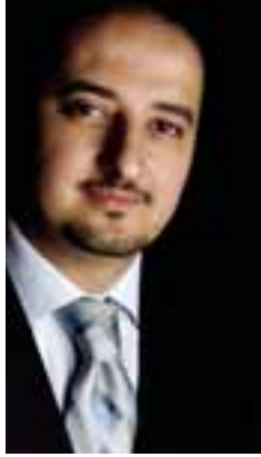
ó a Mó a fi