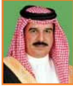
صاحب الجلالة الملك حمد بن عيسى آل خليفة ملك مملكة البحرين