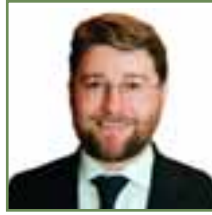
بول مرسر الاستشارات القانونية