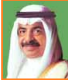
صاحب السمو الشيخ خليفة بن سلمان آل خليفة رئيس الوزراء