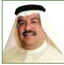
خالد رفيع تمويل المستهلك