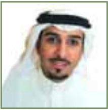
سطوم القصيبي تمويل الشركات