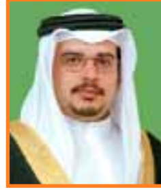
صاحب السمو الشيخ سلمان بن حمد آل خليفة ولي العهد القائد العام لقوة دفاع البحرين