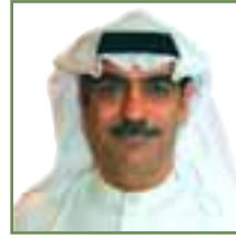
جميل الحاجة الائتمان